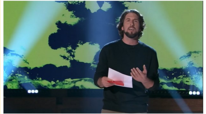
Capture d'écran du vidéo repéré à https://ici.radio-canada.ca/tele/bonsoir-bonsoir/site/segments/prestation/354301/lettre-sante-mentale-david-goudreault

David Goudreault est romancier, poète et travailleur social. Ses œuvres, particulièrement les mots qu'il choisit, captivent son public. David Goudreault possède un don qui va bien au-delà de l'écriture et de l'interprétation. Il touche direct au cœur, avec douceur, générosité et humanité. Il jongle avec les mots et les silences. Ceux qui aident à se relever, qui donnent un sens à la souffrance et qui nous rapprochent.